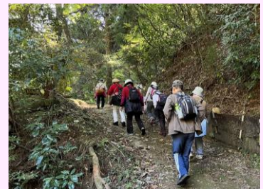
昨年のほのぼのハイキングの様子

※受付をした申込み内容の取扱いには十分注意するとともに、個人情報の複製や転載、第三者への提供は行いません。