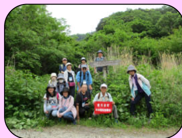
昨年のほのぼのウォーキング（幕山・大石ヶ平）の様子