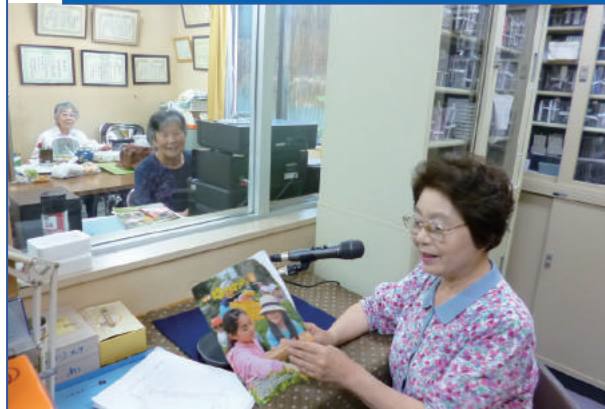
(宮下会館・録音風景)

録音奉仕会は、視覚障がい者の方々に、情報をカセットテープに録音して、無償でお届けする活動をしています。読書が好きなお母さんの仲間で、子育てが一段落したときに、何か社会に役立つ活動をしようと立ち上げました。来年で40年を迎えます。テープは下記の三種類を録音しています。